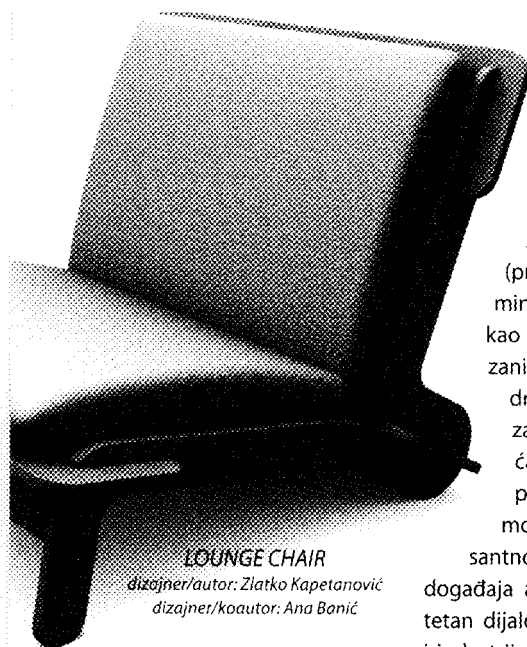
LOUNGE CHAIR dizajner/autor: Zlatko Kapetanović dizajner/koautor: Ana Bonić

poslužio je kao odskočna daska za buduću suradnju između proizvođača i dizajnera (projekt bi trebao trajati minimalno pet godina), i kao takav je uspio. Bit će zanimljivo vidjeti da li će država sljedeće godine zaista dodijeliti obećani budžet za ovaj projekt kako bi se on mogao nastaviti. Interesantno će biti pratiti razvoj događaja ako se ostvari kvalitetan dijalog između dizajnera i industrije. Okrugli stol održan