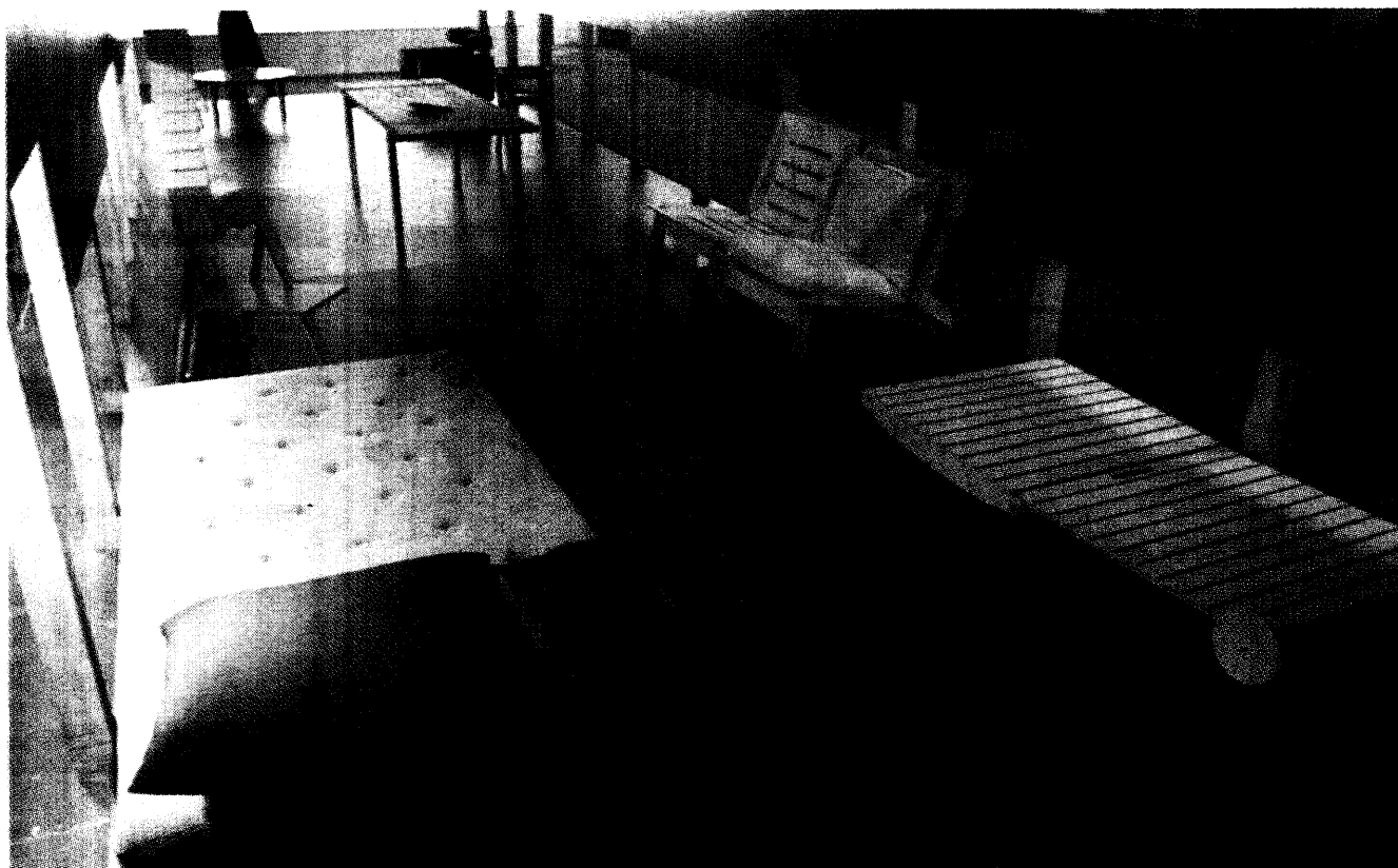
Projektom Dizajn za održivi razvoj, Hrvatski dizajn centar (imaju štand na Ambienti) nastoji ublažiti posljedice rasta uvoza namještaja

- Već desetljećima se ništa ne mijenja, u resornom ministarstvu slušamo samo obećanja - kaže Zvonko Čiček, vlasnik tvrtke iz Zlatar Bistrice, koja se stolarijom bavi već sedamdeset godina, žaleći se na slabu kvalitetu trupaca koji se prodaju domaćim proizvođačima parketa i namještaja. Domaća industrija namještaja najveći problem ima u naplati finalnih proizvoda. Sljedeći problem s kojim se su-