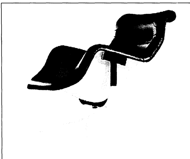
Stolac Karuselli najpoznatije je djelo selektora Yrjõa Kukkapuroa

"Na tržištu je sve očitija polarizacija između proizvođača visoke razine kvalitete i cijene, te Ikee i njenih manje uspješnih klonova. Dok kupce Ikeinih proizvoda primarno zanima cijena, zadovoljenje osno-