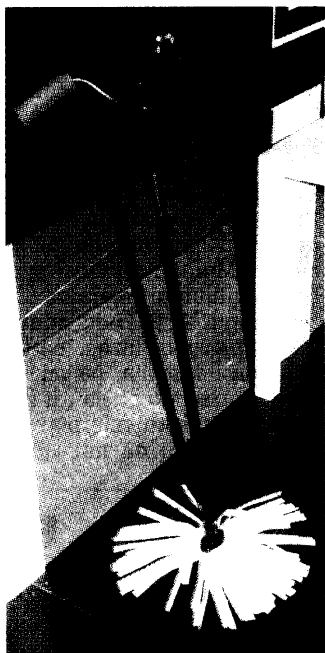
BIKEMOPA: Ovaj proizvod komentar je na tradicionalnu podjelu poslova na muško-ženske, gdje je ženina uloga isključivo vezana za brigu o kući, spremanje, kuhanje... Stoga je napravljen muževni predmet za čišćenje

Iako su na Ambienti predstavljeni prototipovi prvog implementacijskog projekta hrvatskog dizajna u domaću drvenu industriju, okrugli stol održan u Muzeju za umjetnost i obrt (bez prisutnosti stručnjaka Gospodarske komore) pokazao je da su proizvođači još uvijek na oprezu kada je u pitanju domaće oblikovanje